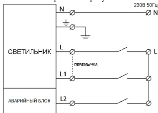
Рисунок 2 Схема подключения светильника

3.3 Схема подключения светильника отображена на рисунке 2.